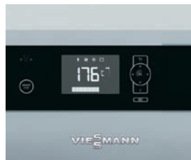
Automatizare Ecotronic 100 intuitivă, cu ecran iluminat

Vitoligno 150-S este un cazan pe lemn cu gazeificare, compact și la un preț atractiv, adecvat atât pentru o funcționare în regim monovalent cât și în regim bivalent (în completarea unei instalații termice pe gaz sau combustibil lichid).