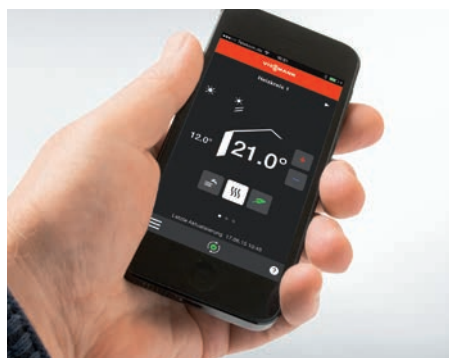
Comunicarea cu instalația termică direct de pe un dispozitiv mobil prin intermediul unei aplicații Viessmann

Cazanul compact pe lemn cu gazeificare este și un excepțional generator de energie termică pentru instalațiile de încălzire pe gaz sau combustibil lichid existente. În regim bivalent, cazanul pe combustibil solid preia sarcina încălzirii și preparării apei calde menajere. La temperaturi extrem de scăzute, se conectează și cazanul convențional pentru a prelua din sarcină de vârf.